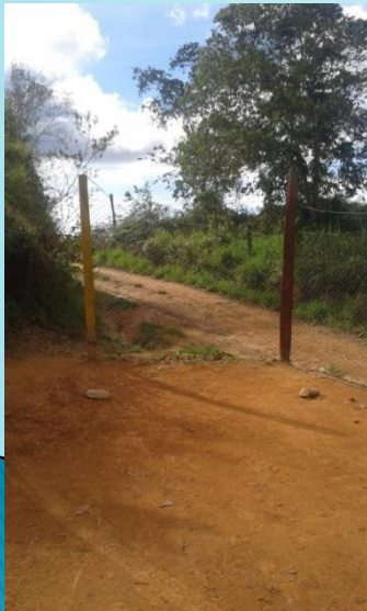
Encerramiento Sedes I y J