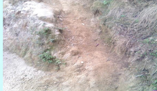
Construir un muro de contención para evitar el desprendimiento de tierra en el lateral del restaurante, de los Cocos.