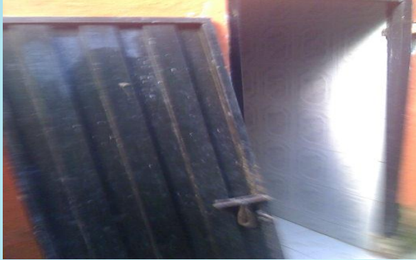
Arreglo de puertas Y acceso para la Sede C