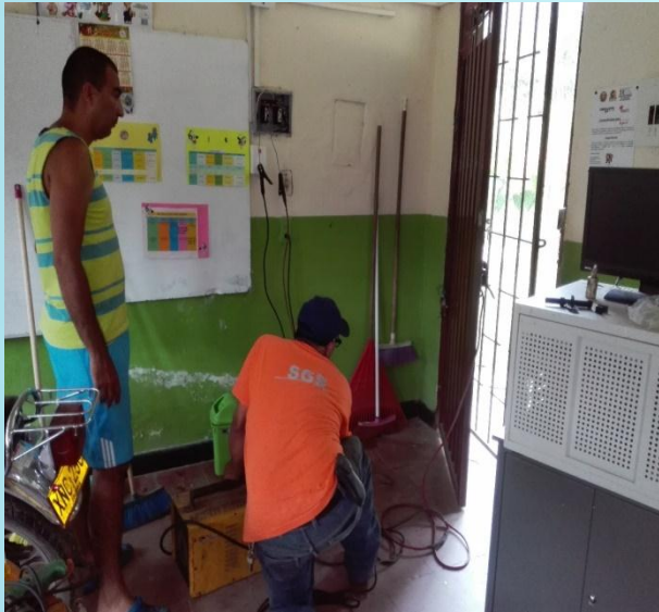
Mantenimiento, arreglo y seguridad para algunos accesos escolares en la Sede Honduras