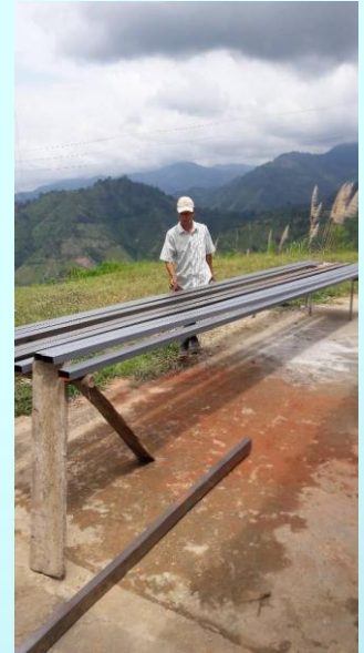
Arreglo de cocina, comedor y sala de computo. Sede El Samán