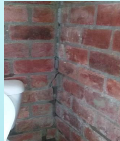
Arreglo de baterías sanitarias Sede G