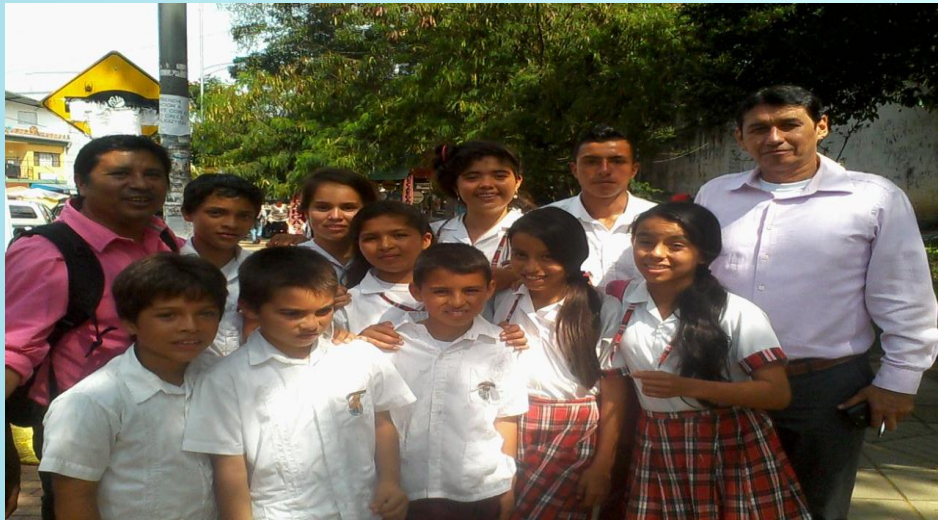
Salida Pedagógica a la UIS y UNAB

La estrategia pedagógica es coherente con el horizonte institucional y se aplica en todas las sedes