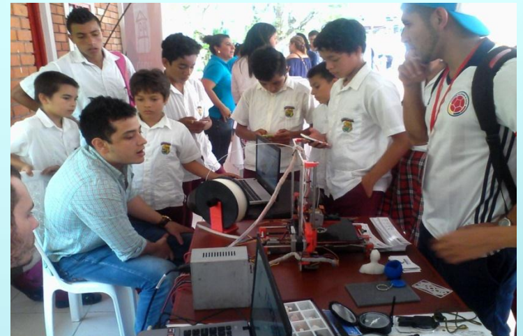
Feria pedagógica generación conciencia – UNAB BUCARAMANGA