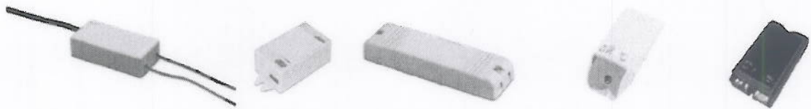
Ejemplos de Drivers para fuentes luminosas LED. Gráfica tomada de "Joint CELMA / ELC Guide on LED related standards. 3rd Edition, July 2011"

También suelen denominarse como "fuentes de alimentación" para iluminación LED o "Drivers".